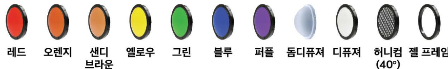
레드 오렌지 샌디 브라운 옐로우 그린 블루 퍼플 돔디퓨저 디퓨저 허니컴 젤 프레임 (40°)