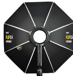
소프트박스 천 + 스피드링

★ 구성 : Speedbox-Flip 본체, 전용가방, 어댑터(별도구매)