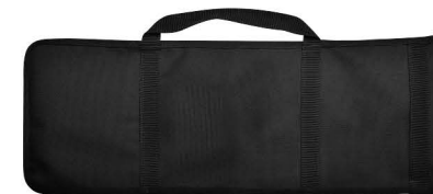
전용가방 가방 디자인은 변경될 수 있습니다.