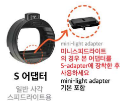
S 어댑터 일반 사각 스피드라이트용